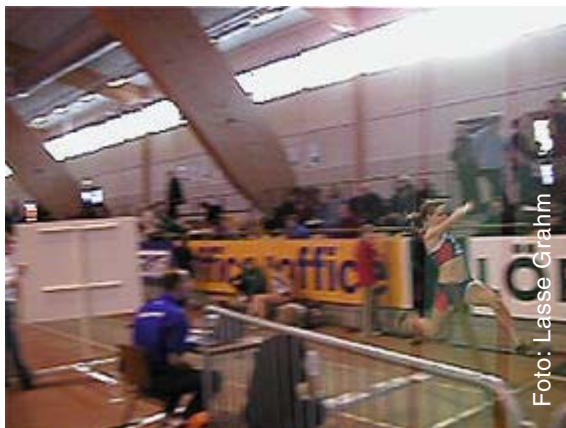
Blir det något hoppande i en egen hall framöver? Det kan vi själva påverka.

Ökar våra kostnader i framtiden, eller om vi inte kan sälja Bingolotter eller Täby Centrumhäften, så kan den nuvarande verksamheten behöva ytterligare medel. Därmed ökar behovet av ytterligare höjningar av medlemsavgiften. Det är en realitet som måste