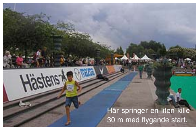
Här springer en liten kille 30 m med flygande start.

Lilla DN Galan hölls 24 juli i år. Den lockar yngre barn att börja friidrott. Både Lilla och Stora DN galan arrangeras av stadionklubbarna där TIS ingår.