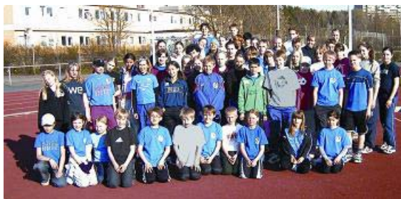
På Tibblevallen hittade vi några grabbar en onsdag. Här är de i majoritet.